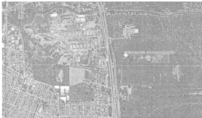
Imagen satelital. Localización del pozo profundo construido en la sede deportiva Bomboná.

El agua del pozo se capta empleando una bomba eléctrica sumergible tipo lapicero con potencia de 7,5 HP y se conduce directamente al sistema de riego de las canchas de fútbol.